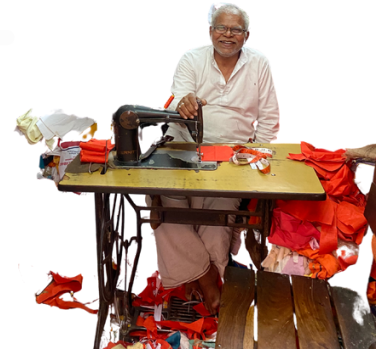
パルマースニケタンの仕立て屋のおじさん